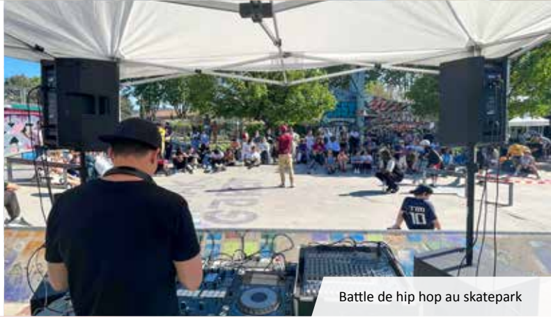
Battle de hip hop au skatepark