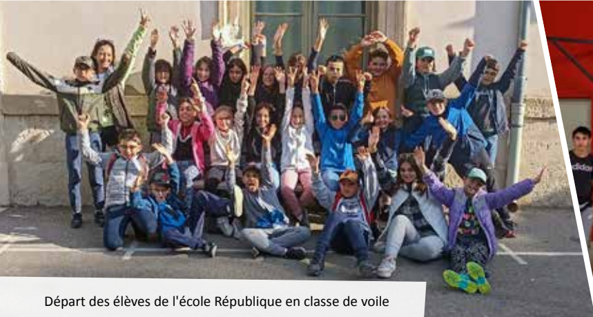
Départ des élèves de l'école République en classe de voile