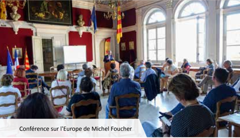
Conférence sur l'Europe de Michel Foucher