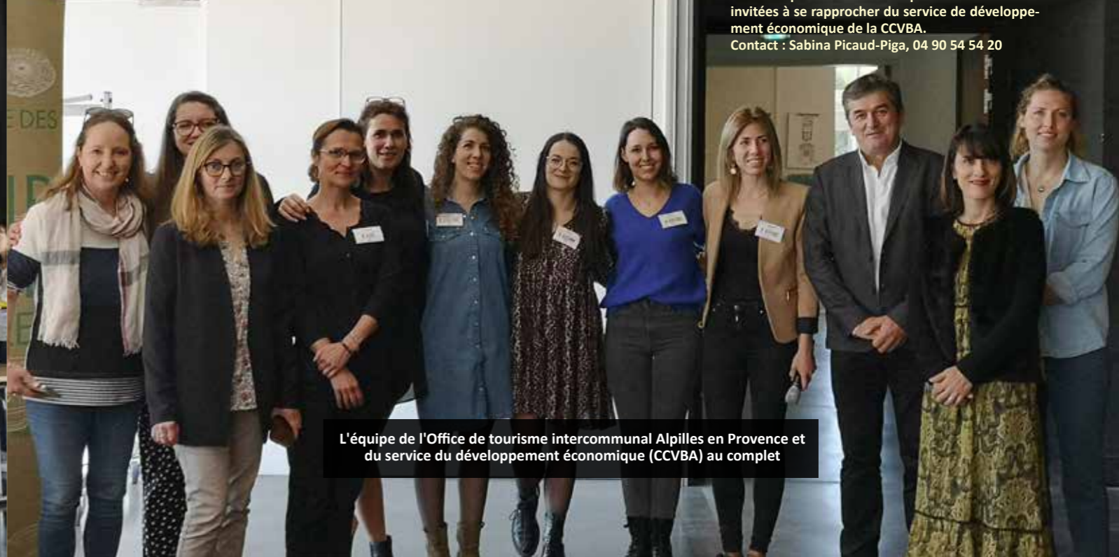
L'équipe de l'Office de tourisme intercommunal Alpilles en Provence et du service du développement économique (CCVBA) au complet