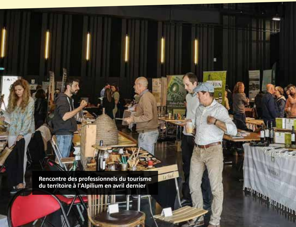
Rencontre des professionnels du tourisme du territoire à l'Alpiliun en avril dernier

Les entreprises intéressées par des locaux sont invitées à se rapprocher du service de développement économique de la CCVBA. Contact : Sabina Picaud-Piga, 04 90 54 54 20