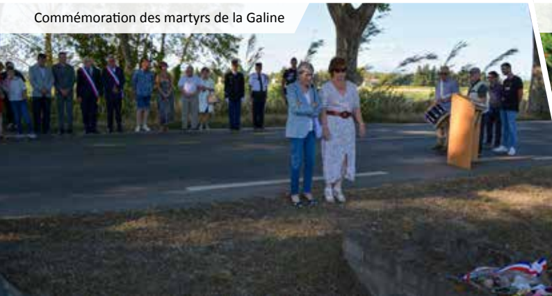
Commémoration des martyrs de la Galine