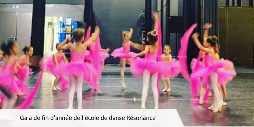
Gala de fin d'année de l'école de danse Résonance