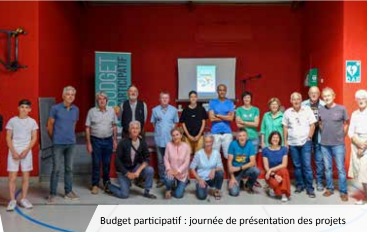
Budget participatif : journée de présentation des projets