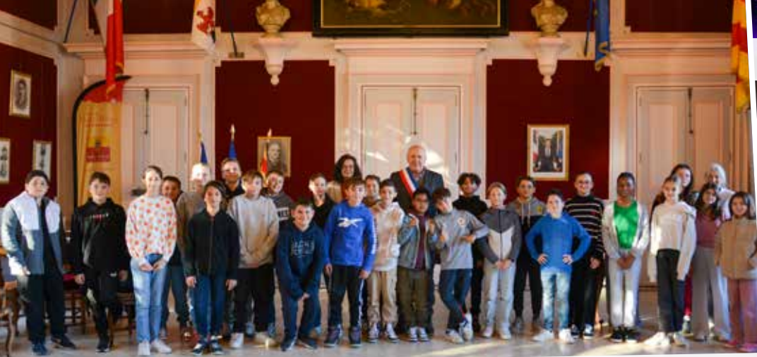
Rencontre du Maire avec les délégués du collège Glanum