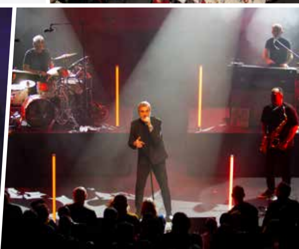
Salle comble à l'Alpilium pour le concert d'Electro Deluxe