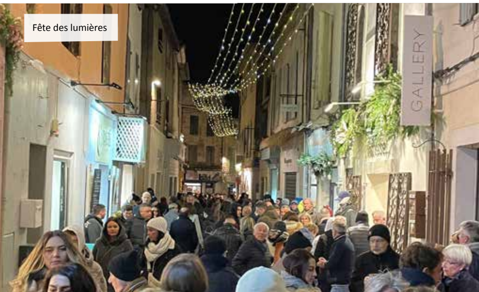
Fête des lumières