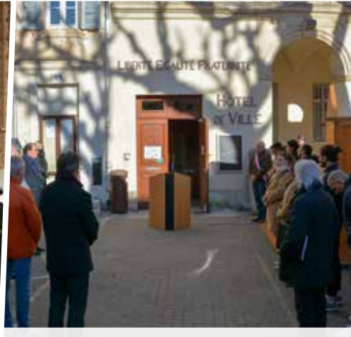
Minute de silence en soutien à Mayotte, dévastée par le cyclone Chido