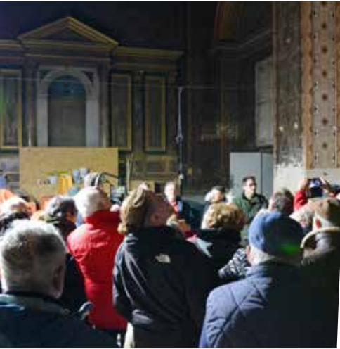
Visite publique de la collégiale Saint-Martin