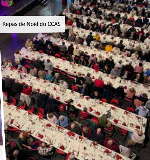
Repas de Noël du CCAS