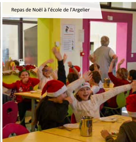
Repas de Noël à l'école de l'Argelier