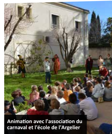
Animation avec l'association du carnaval et l'école de l'Argelier

Cette dynamique a valu à l'Ehpad une note globale de 3,4 sur 4 lors de l'évaluation HAS, ainsi qu'une étoile (note maximale) pour son approche inclusive.