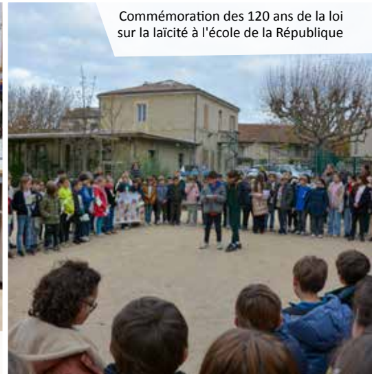
Commémoration des 120 ans de la loi sur la laïcité à l'école de la République