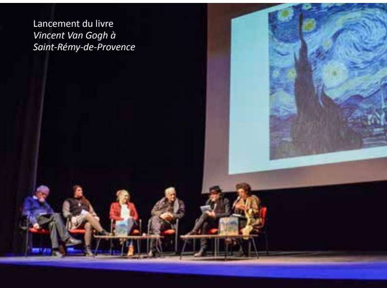
Lancement du livre Vincent Van Gogh à Saint-Rémy-de-Provence