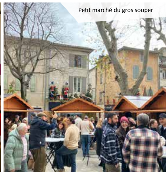
Petit marché du gros souper