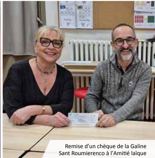
Remise d'un chèque de la Galine Sant Roumierenco à l'Amitié laïque