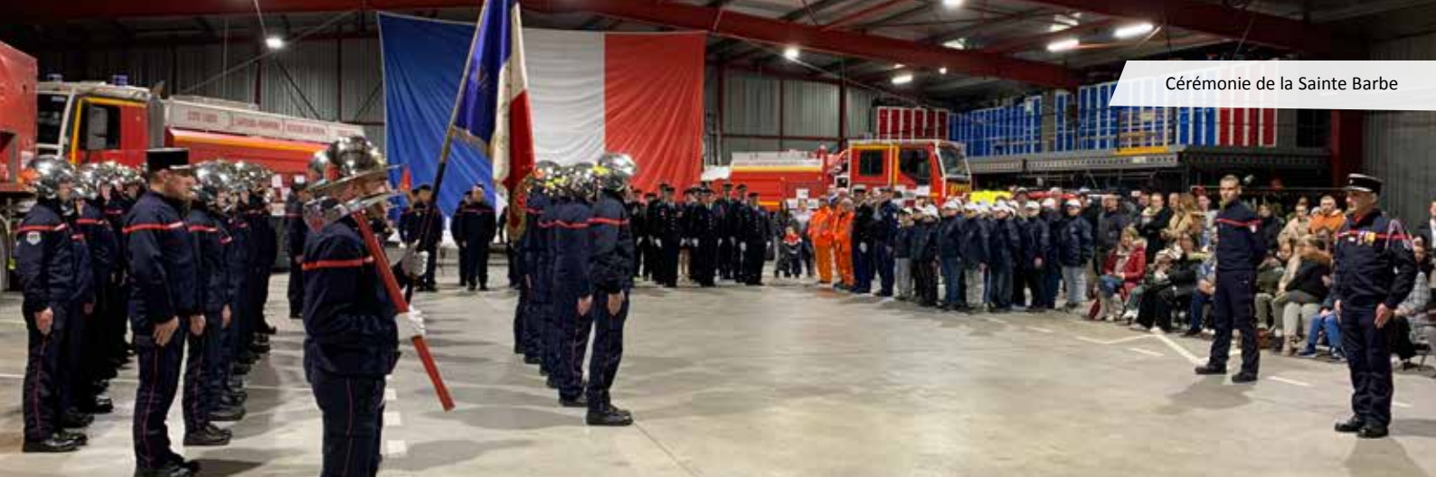
Cérémonie de la Sainte Barbe