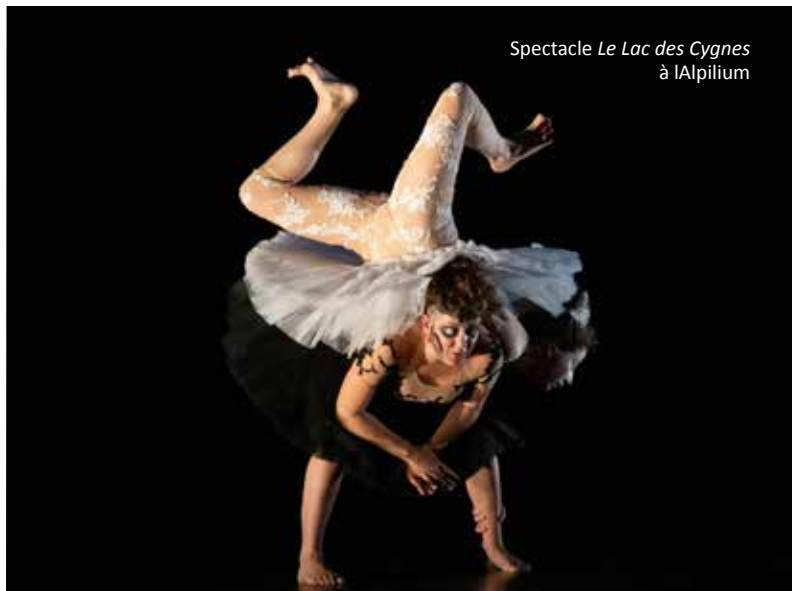
Spectacle Le Lac des Cygnes à l'Alpilium