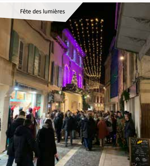
Fête des lumières